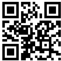
微信（百度地图）扫码